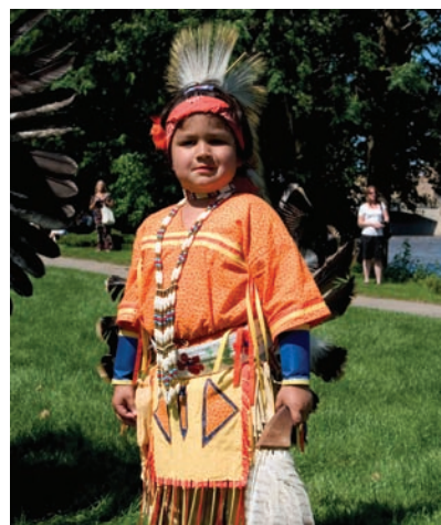
A proud boy prepares to dance at Tuesday's Pow Wow.

Le culte fut présidé par Mary Fontaine, pasteure de l'Eglise Presbytérienne du Canada,