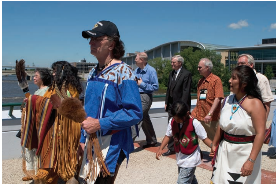
WCRC leaders and Native Americans cross the bridge to Tuesday's Pow Wow.